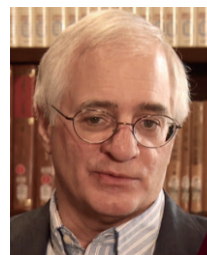
マイケル・クスmano 教授